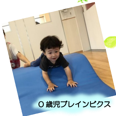
0歳児プレインピクス